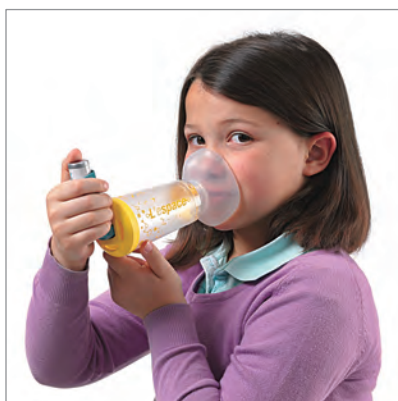
● 小児 (対象年齢: 2~6歳)