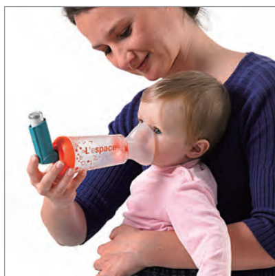
● 乳幼児 (対象年齢: 0~2歳)