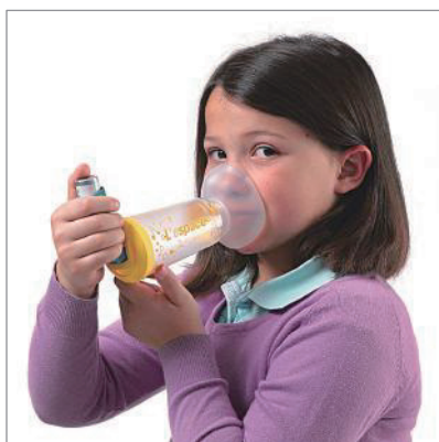
● 小児 (対象年齢: 2~6歳)