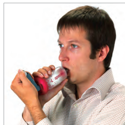
● 成人 (対象年齢: 6歳~)