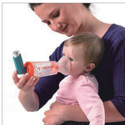
● 乳幼児 (対象年齢: 0~2歳)