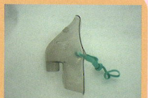
<0550120>マスク (大) (別売品) ※マスク(大)は標準セットには含まれません。

製造販売元 TMI 株式会社 東京エム・アイ商会 〒135-0023 東京都江東区平野3-2-6 TEL.03-6458-5588 FAX.03-6458-5518 受付時間 9:00-17:00 月～金(土・日・祝日・年末年始除く)