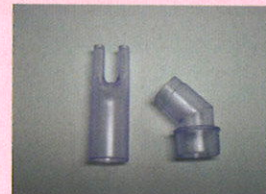
<0550090> ノーズピース2000 (L字アダプタ付)