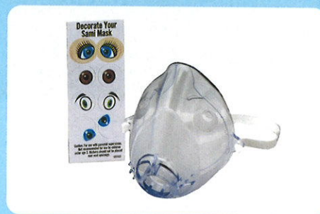
サミザシールマスク (小児用)

サミザシール マスク (小児用) は、通常のマスクより柔らかな素材を使用した、子供に優しいマスクです。